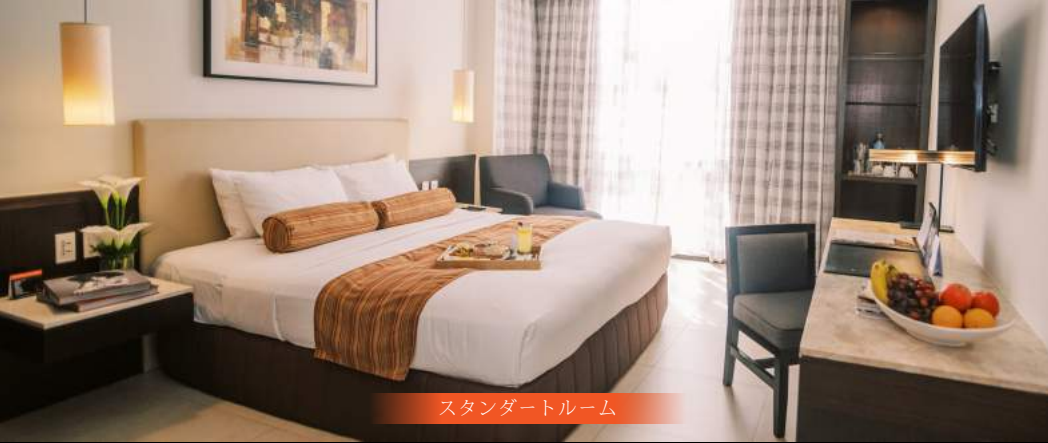
スタンダードルーム