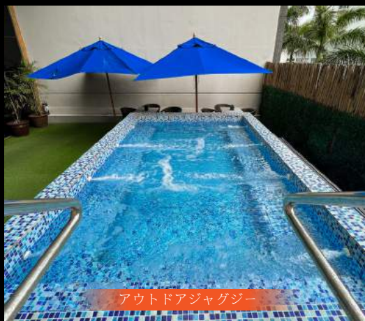
アウトドアジャグジー