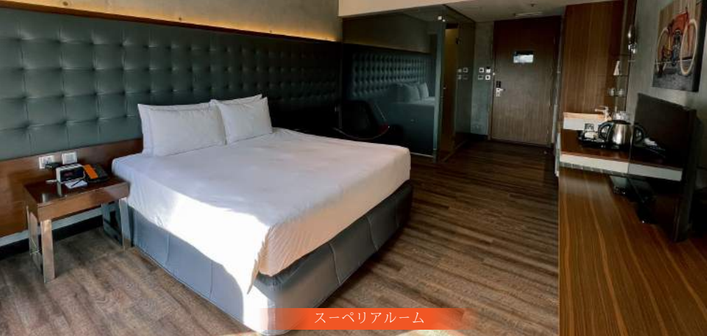
スーペリアルーム