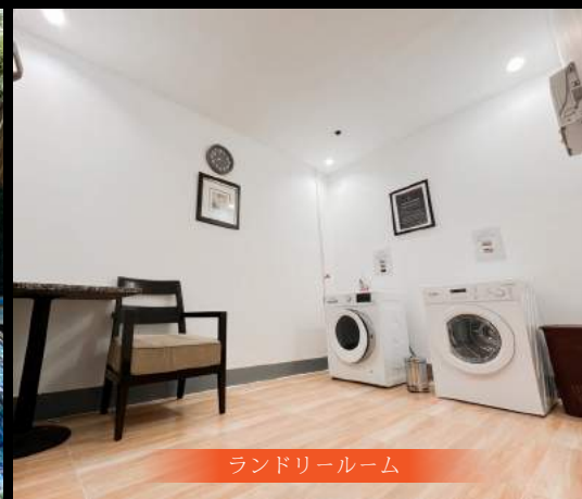
ランドリールーム